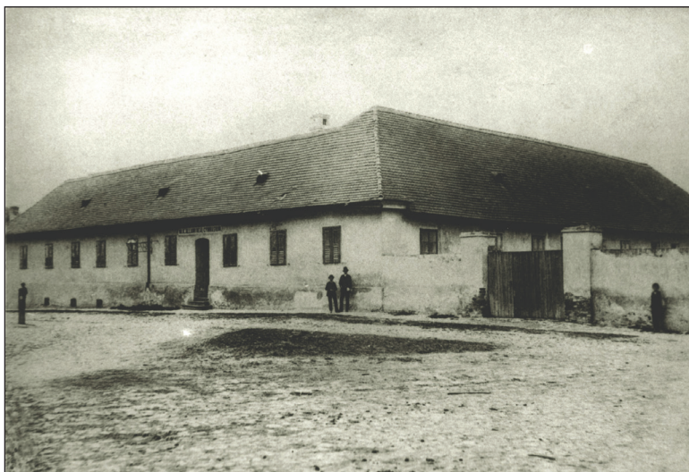
Слика 4. Изглед Више реалне школе коју је похађао Михајло Пупин

на месту где се данас налази зграда Гимназије. У тој старој згради је школа остала све до 1885. године, када је привремено пресељена да би се на месту те старе, трошне зграде подигла нова зграда у којој се данас налази Гимназија.