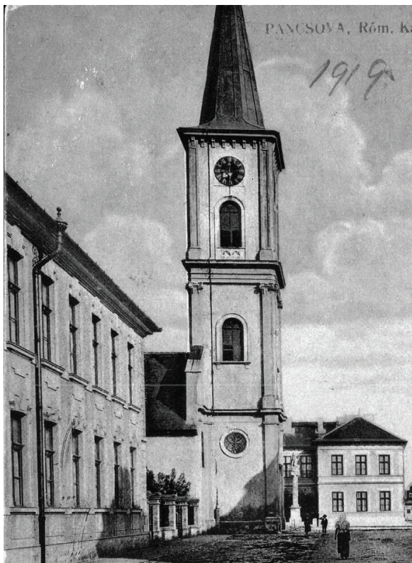
Слика 2. Зграда Главне школе (лево). Разгледница из 20. века.

У аутобиографији Уроша Предића – први део, до 1921. године, може се пронаћи следеће: