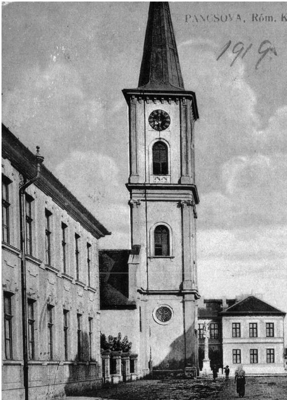
Слика 2. Зграда Главне школе, поред католичке цркве