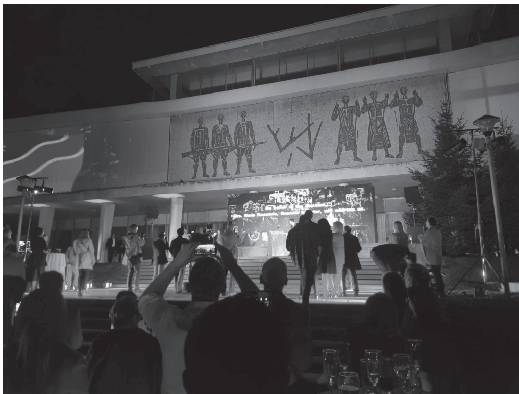
Свечано отварање изложбе Прометјеји новој века , Музеј Југославије, фотографија аутора

корене или ће остати манифестационог карактера, без јаке и сталне државне подршке.