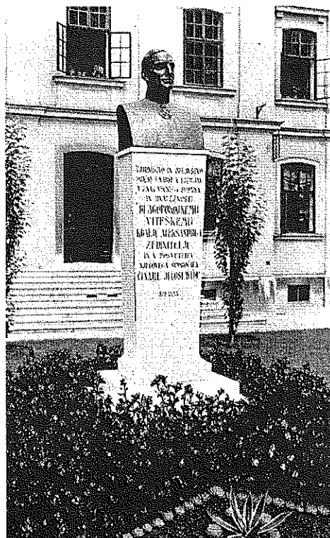
Бистра краља Александра