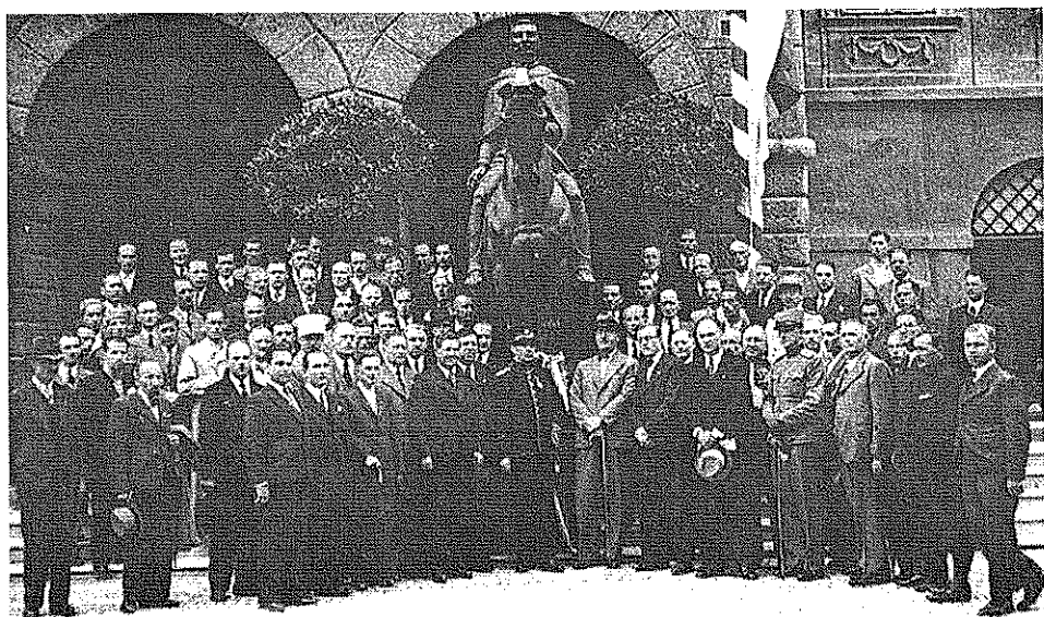
Откривање споменика краљу Петру