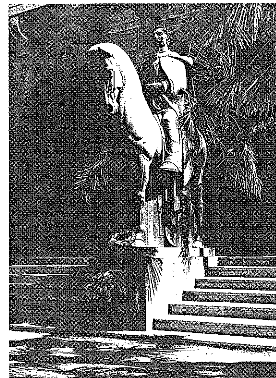
Споменик краљу Петру

његово откривање и свечаности које су га пратиле представљале прве значајније јавне манифестације у Дравској бановини од увођења шестојануарске диктатуре 1929. године, а такође и од спајања љубљанске и мариборске области у јединствену управну јединицу, одн. Бановину, чији је Љубљана постала центар. Управо стога, ове свечаности су представљале специфичан лакмус за мерење словеначког јавног мњења. Како се постављање споменика краљу Петру поклопило са десетогодишњицом владања краља Александра I и симболично његово откривање одређено на рођендан младог престолонаследника Петра – 6. септембар, оно је требало да вишезначно утиче на словеначку јавност. Управо тога је и одређено као централни догађај око које је организована тзв. „Краљева недеља”, која је обухватила читав низ културних приредби и јавних манифестација, као показатеља привржености народа династији Карађорђевића и јединственој централизованог држави јужних Словена.