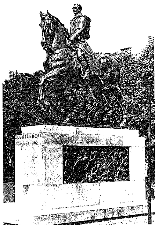
Споменик краљу Александру

ним слетом, којим су ђачке и физкултурне организације Словеније честитале рођендан младом владару. Као и свечаности приликом откривања споменика краљу Петру, и ови догађаји директно су били преношени на таласима Радио станице Љубљана. По неким проценама откривању је присуствовало више од 50000 грађана. 26 Била је то демонстрација јачине младе краљевине у тренуцима када се на њеним западним границама појавио нови сусед – Трећи рајх и када је било нужно показати народно јединство, али и саме грађане у то уверити. Само седам месеци касније споменик и држава која га је подигла нестали су у турбулентним годинама II светског рата.