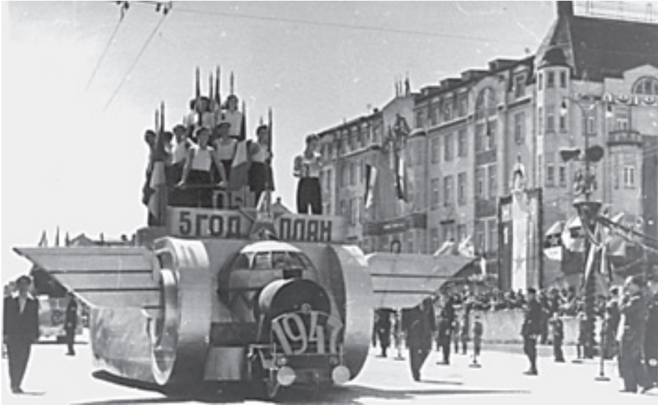
Proslava 1. maja 1947. u Beogradu