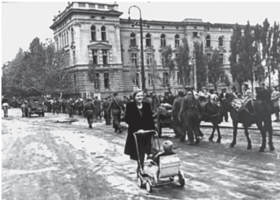
Jedinice NOVJ ulaze u oslobođeni Beograd, oktobra 1944.

Od početka devedesetih godina 20. veka, simboli socijalizma su postepeno, ali kontinuirano potiskivani iz javnog prostora, a sa njima su nestali i simboli antifašizma. Menjao se kalendar proslava, imena ulica, škola, državnih institucija. Pojmovi i simboli koji su umesto njih inaugurisani, najčešće su bili lišeni emotivnog i političkog sadržaja i nisu uspeli da povežu zajednicu na novim osnovama. Simboli prethodnih vremena koji su postavljeni u javnom prostoru ostali su nekomunikativni, jer nikada zapravo nisu ni promovisani. Ipak, uspeli su da izbrišu faktografiju i simbole koje su zamenili. Emocije, međutim, nisu. Datum oslobođenja Beograda je zaboravljen, ali su partizani i Crvena Armija ostali zapamćeni kao oslobodioci, čak i pošto su stavljani u neke nove potpuno izmenjene kontekste.