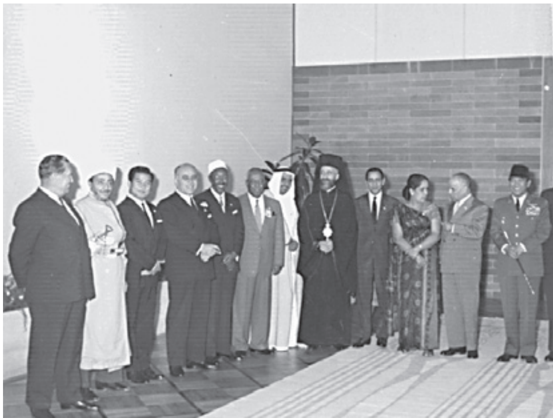
Državnici, učesnici Prve konferencije nesvrstanih zemalja u Beogradu, 1. septembar 1961.

Fotografije iz arhiva Muzeja istorije Jugoslavije, Beograd.