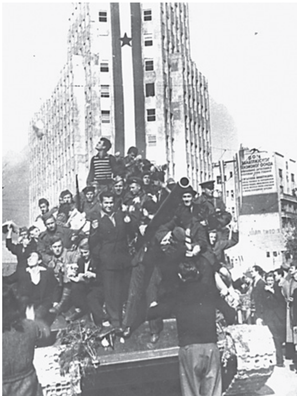
U oslobođenom Beogradu, Terazije, oktobra 1944.