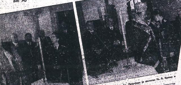
Краљ Петар II и патријарх Јосиф Пајић приликом заклетве. После поворачког заступања Њ. Св. Патријарха је посетио Њ. В. Краља у Двору на Дедињу.

Подавања заклетве, које је извршено у Двору на Дедињу, проређена саборној цркви и свима другим богомољама у Београду благодарена за дуг живот и срећну владавину Њ. В. Краља Петра II