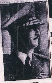
Армиски генерал г. Душан Симовић