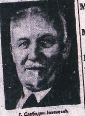
г. Слободан Јовановић