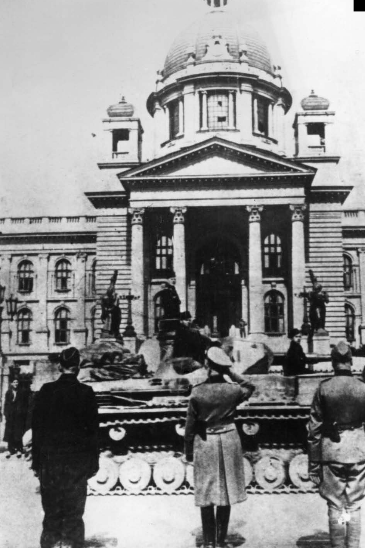
Nemačka pobjednička parada ispred Skupštine, april 1941.