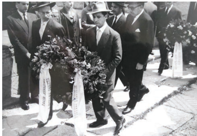
Сл. 8 / Представници амбасаде Израела у Београду йолажу венац на споменик йоводом Јом хашоа (Дана сећања на жртйве Холокаустйа), 27. айрила 1958.