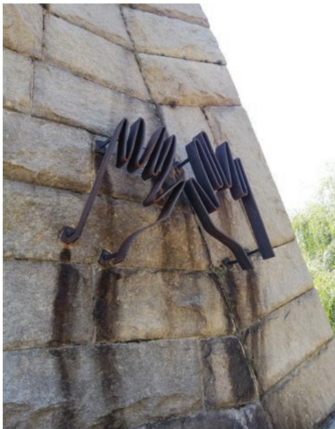
Сл. 3 / Споменик, детаљ, руке Коена

Богдановић је био задовољан својим делом, али његово мишљење је остало усамљено и споменик је у стручним круговима примљен прилично хладно, а било је и мањих инцидената и покушаја да се упадне на градилиште и спречи изградња. 33 Иако у ондашњој југословенској јавности није привукао велику пажњу, Богдановићев споменик је ипак донео извесне новине, које ће се у виду уметничких образаца, у деценијама које су уследиле, често појављивати у југословенској меморијалној архитектури. Међу тим новим уметничким идејама вероватно је најзначајније Богдановићево одбијање да на споменику представи антропоморфне приказе жртава, целата или бораца, као и јасне идеолошке симболе комунизма, изузев мале и готово не приметне петокраке на гранитној плочи постављеној на бочни део десног пилона. Од конкретних визуелних симбола присутни су само они јеврејски (менора, Давидова звезда, Мојсијева плоче, руке Коена), јер је њихово појављивање било неопходно како би пројекат задовољио основне захтеве прописане конкурсом.