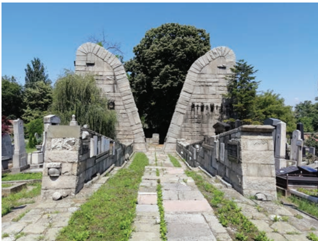
Сл. 1 / Данашњи изглед сјоменика

Тако је једна реч родила моју професију. 28 Богдановићев споменик се састоји од три дела, који наративним путем уводе посматрача у тематику, правећи тако класичну трочлану композицију која обухвата експозицију, заплет, кулминацију. 29 Први део споменика (експозиција) представља прилазна стаза оивичена с обе стране ниским зидом и поплочана старим јеврејским надгробним споменицима. С обзиром на то да средства прикупљена за подизање споменика нису била довољна, градске власти су дозволиле Богдановићу и његовим сарадницима да на дунавским обалама Дорћола, где се налазила депонија материјала од зграда срушених у бомбардовањима Београда, сакупе материјал који би био погодан за изградњу споменика. 30 На тај начин су, уз старе јеврејске споменике, у овај меморијал уграђени и делови срушених београдских кућа, што је требало да нагласи везу с традицијом али и конекцију са старим Београдом, градом у којем је живео највећи број јеврејских жртава са територије Србије.