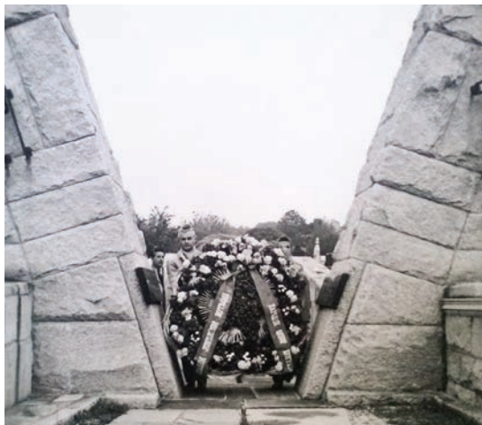
Сл. 7 / Представници Народної одбора Београда полагају венац йоводом Дана йовбеде над фашизмом 9. маја 1956.