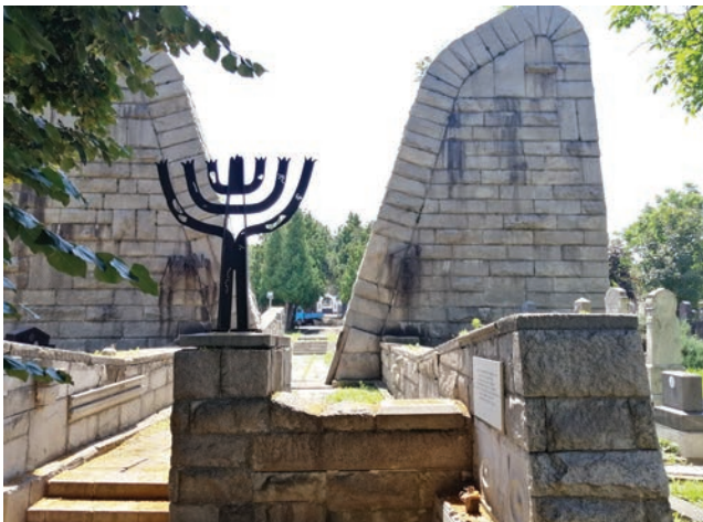
Сл. 5 / Споменик, изглед с налицја

вши значај одсуства просте дидактике, тривијалне монументалности и ритуалне патетике. 35 Посебно је похваљено то што у оваквом начину репрезентације страдања нема ламентација, нема никаквој нарицања, нема никакве обредне ритуалности, нема никаквој театарској олакшавања које ремети историју и доисторијанство, испраћајући жртве с поштовањем без крућних епитиха и са мало речи. 36 Поред тога, члановима жирија су се допале и оригиналност и неконвенционалност Богдановићевог пројекта, те су његово идејно решење описали као знајан формални домет ослобођен конвенционалној стереотипности проблема и без ослањања на познате узоре, омоћујући јак и свечан доживљај . 37 На крају, не треба занемарити ни практичне аспекте, па је победи Богдана Богдановића на конкурс допринело и то што је његово идејно решење било најјефтиније од свих понуђених. 38