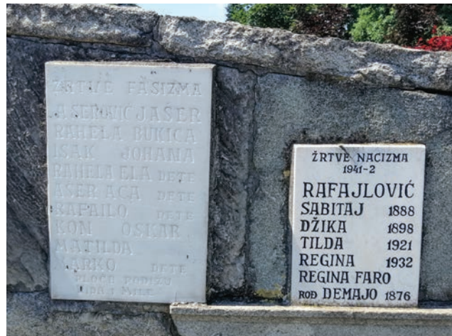
Сл. 6 / Споменик, детаљ, бочни зид прилазне стазе, спомен-плоче жртвама Холокауста