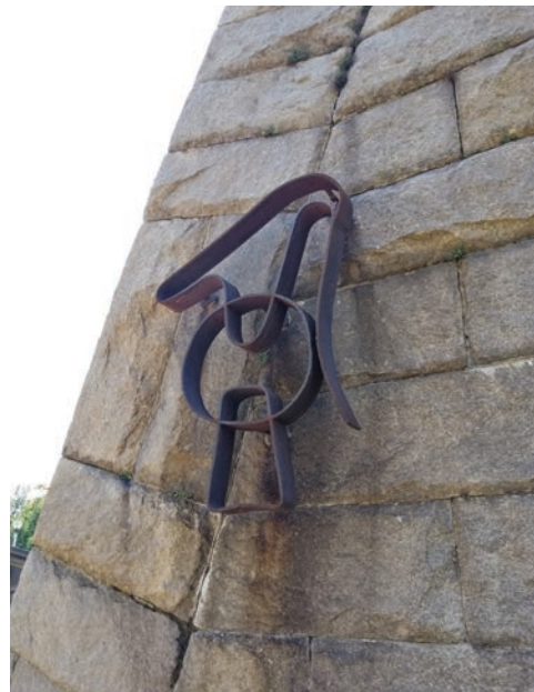
Сл. 4 / Споменик, детаљ, крчај Левија

Богдановић је био задовољан својим делом, али његово мишљење је остало усамљено и споменик је у стручним круговима примљен прилично хладно, а било је и мањих инцидената и покушаја да се упадне на градилиште и спречи изградња. 33 Иако у ондашњој југословенској јавности није привукао велику пажњу, Богдановићев споменик је ипак донео извесне новине, које ће се у виду уметничких образаца, у деценијама које су уследиле, често појављивати у југословенској меморијалној архитектури. Међу тим новим уметничким идејама вероватно је најзначајније Богдановићево одбијање да на споменику представи антропоморфне приказе жртава, целата или бораца, као и јасне идеолошке симболе комунизма, изузев мале и готово не приметне петокраке на гранитној плочи постављеној на бочни део десног пилона. Од конкретних визуелних симбола присутни су само они јеврејски (менора, Давидова звезда, Мојсијева плоче, руке Коена), јер је њихово појављивање било неопходно како би пројекат задовољио основне захтеве прописане конкурсом.