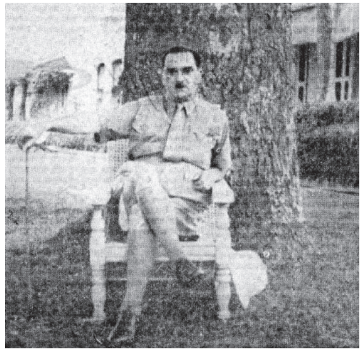
Слика 2. Милан Стојадиновић у Редвију 1941. ( Коло , 7. 3. 1942, 9)

Други део текста је историјат Маурицијуса, његова демографија, као и подаци о биљном и животињском свету. Оно што је несумњиво јесте да су прибављене информације и фотографије добијене од породице, а базиране су на Стојадиновићевим писмима