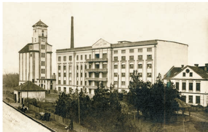
Слика 5 / Figure 5