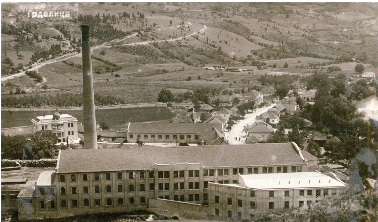
Слика 6 / Figure 6