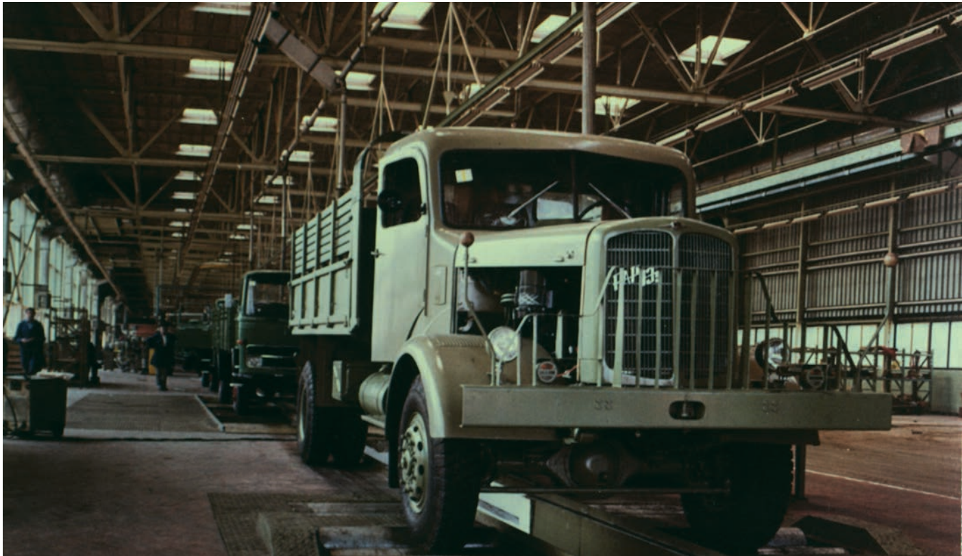
Слика 2 / Figure 2