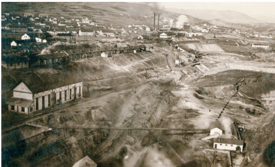
Слика 3 / Figure 3