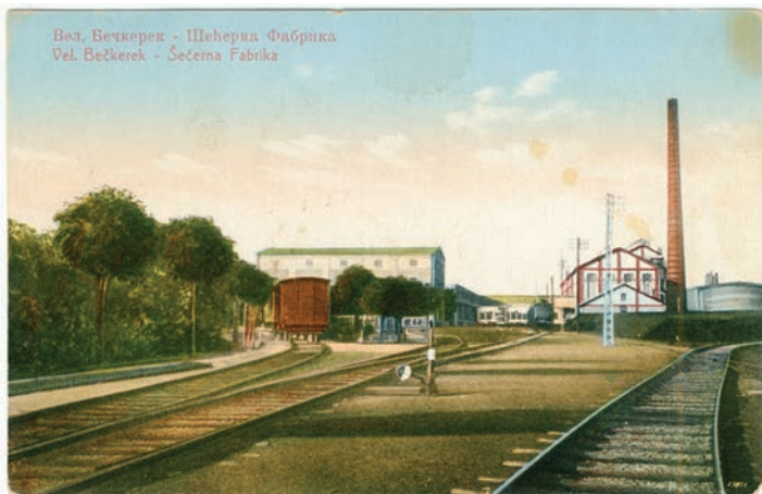
Слика 4 / Figure 4