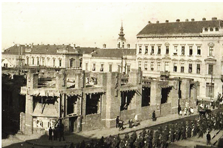
Зграда Српске краљевске академије у изградњи

буду научне установе и научници, књижевници и уметници, уверавао је Цвијић окупљене колеге и осталу публику, насупротив разорном утицају страначких и личних интереса који драстично успорава и отежава успостављање јединства. Ипак, према мишљењу председника СКА, период бурног превирања не може још дуго трајати. Страсти ће се ускоро смирити, али ни после тог преокрета српско-хрватске односе неће обележавати потпуни склад и спокојство јер је изједначавање Срба и Хрвата дуготрајан историјски процес. Своје излагање завршио је речима које су изражавале његово схватање „јавног рада“ и које су биле нека врста савета југословенским политичарима: да се у политици мудрост огледа у уочавању и коришћењу елемената који доприносе зближавању, а не у подстицању тензија и сукоба, те како ће за јединство у држави највише учинити смерни и скрушени који мирно приме и отрпе многе неправде и увреде.