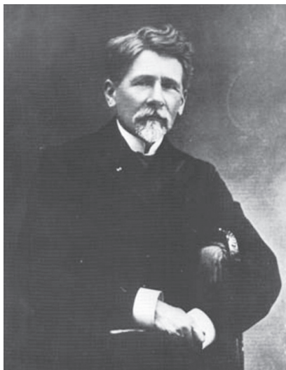
Сима Лозанић (1847–1935), хемичар, први ректор Универзитета у Београду и председник Српске краљевске академије 1899–1900. и 1903–1906. године

Чим је изабран за редовног члана СКА, Цвијић је ушао у тек основан (1898) Етнографски одбор, преузимајући рад на испитивању српских села, који је претходно већ био започет у Географском заводу Велике школе. На свечаном годишњем скупу 1900. године поднео је извештај о раду у претходној години, констатујући да је испитивање села у Србији већ толико одмакло да би тај посао ускоро могао бити завршен и заокружен дефинитивним сређивањем прикупљеног материјала и извођењем закључака.