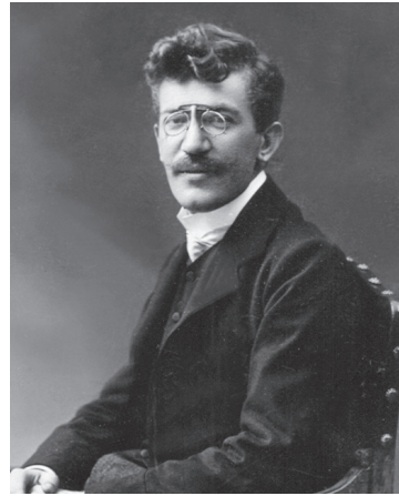
Стојан Новаковић (1842–1915), председник владе Краљевине Србије, филолог, председник Српске краљевске академије од 1906. до 1915. године