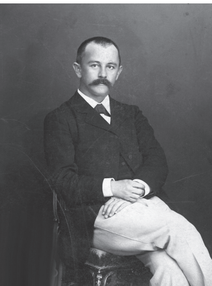
Јован Цвијић у време када је примљен у Српску краљевску академију.