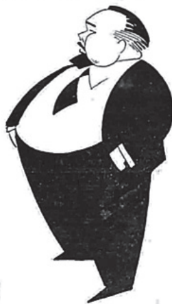
Несуђени „Плацкомандант“ Берлина (Цртеж: Ђ. Јанковић)

Београдске општинске новине, бр. 62, 15. јун 1941.