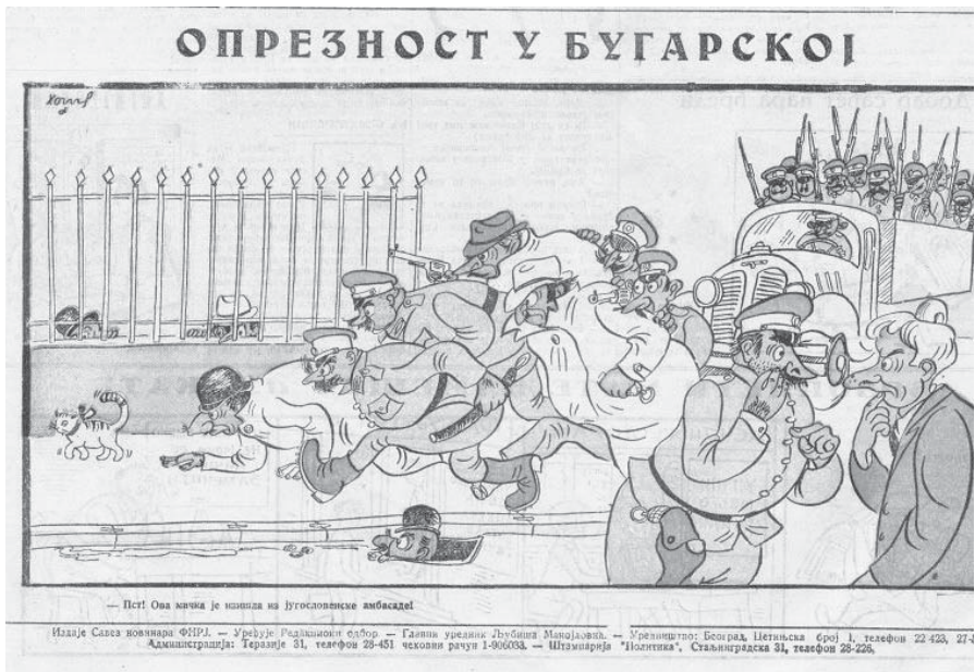
Слика 10: Опрезносћ у Бугарској , „Јеж“, 22. октобар 1949. ( Пст! Ова мачка је изишла из југословенске амбасаде )