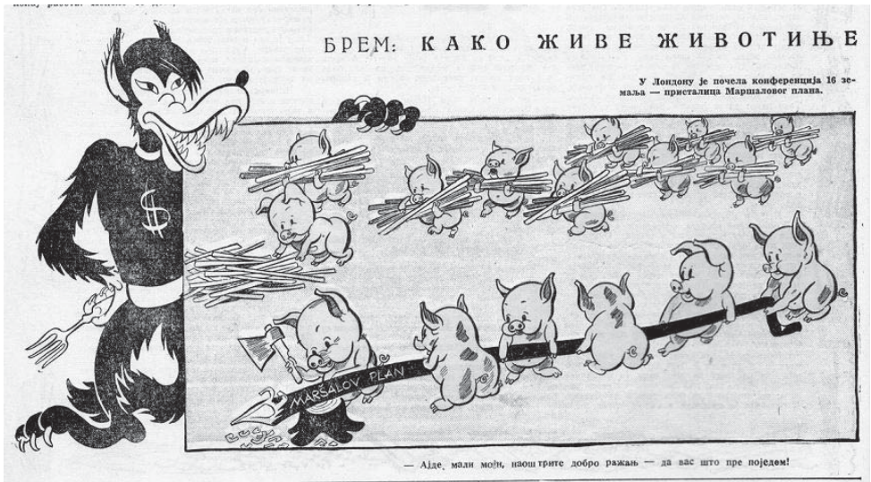
Слика 3: Брем: Како живе животиње , „Јеж“, 20. март 1948 (у Лондону је почела Конференција 16 земаља – присталица Маршаловог плана)