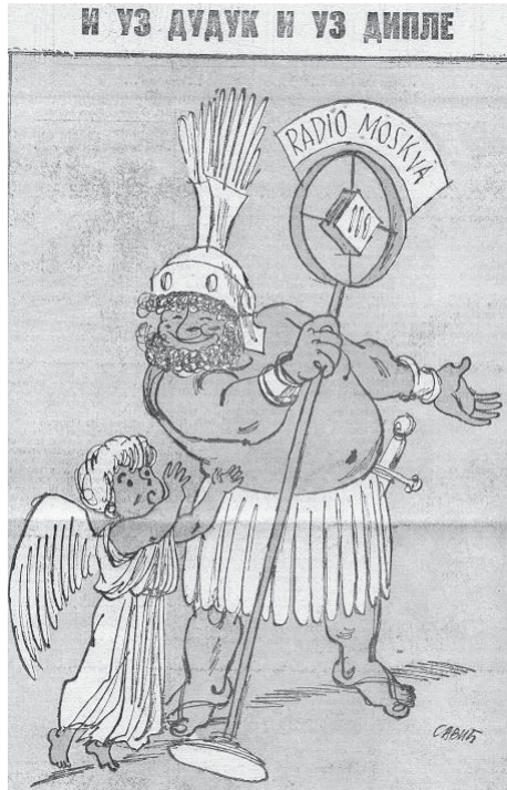
Слика 9: И уз дудук и уз дилпе , „Јеж“, 30. септембар 1950.