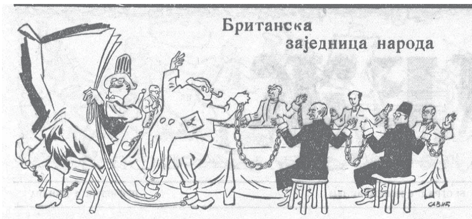
Слика 5: Британска заједница народа, „Јез“, 6. новембар 1948.