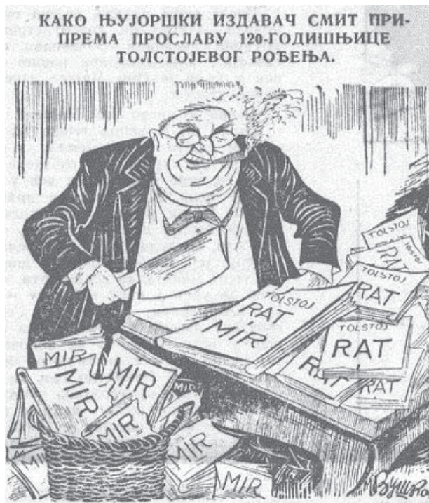
Слика 4: Како њујоршки издавач Смит припрема прославу 120. годишњице Толстојевог рођења , „Јеж“, 9. октобар 1948.