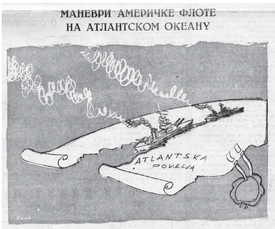
Слика 6: Маневри америчке флотје на Атлантском океану, „Јез“, 8. јануар 1949.