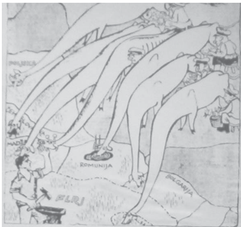
Слика 8: Крвожирафа, „Павлиха“, 22. октобар 1949.