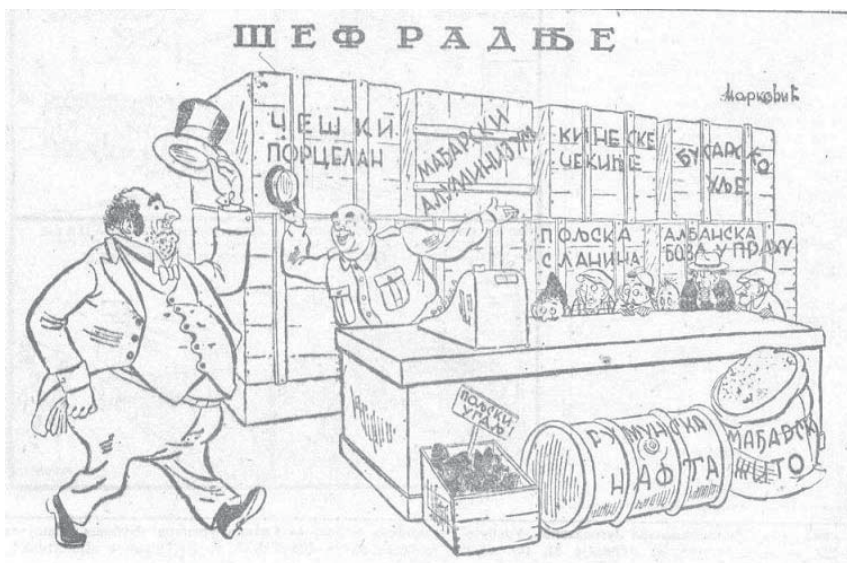
Слика 7: Шеф радње, „Јез“, 15. април 1950.