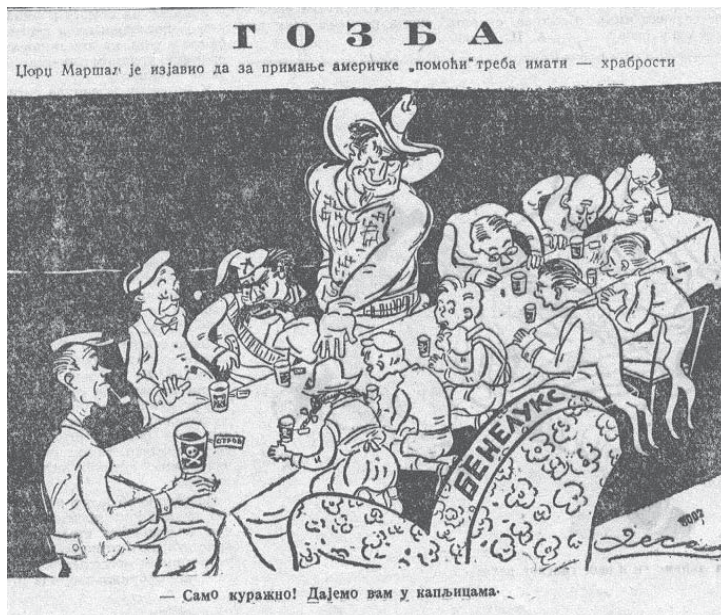
Слика 2: Гозба, „Јеж“, 19. јун 1948.